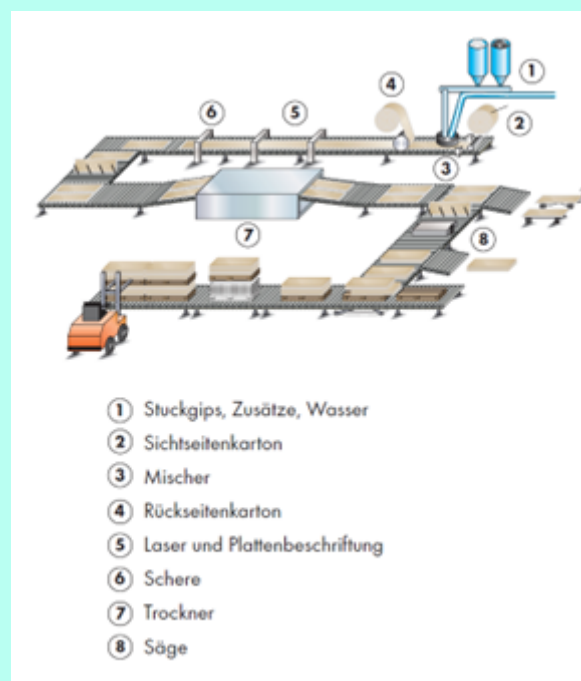
Bild 1: Herstellungsprozess von Gipsplatten

Herkunft und Anteil der Rohstoffe, herstellereigene und spezielle Prozessketten, besondere Verarbeitungsmethoden.